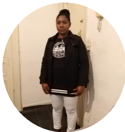
Hawa Kalissa Jeune ASBL Odyssée